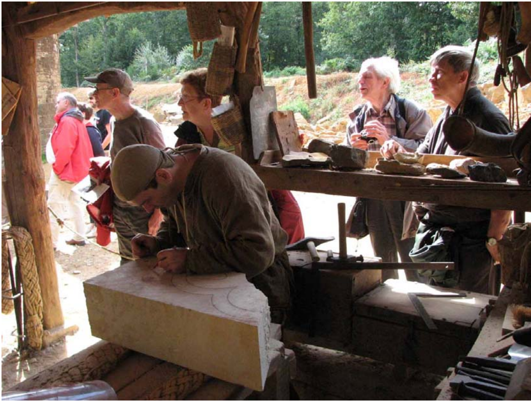
Guédelon vrijdag 12.09.2008