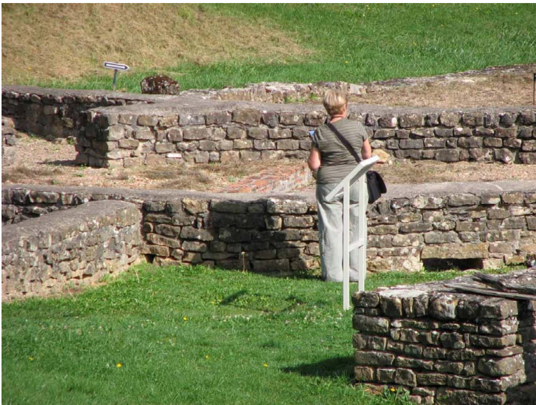
St. Père sous Vézelay, Les Fontaines Salées