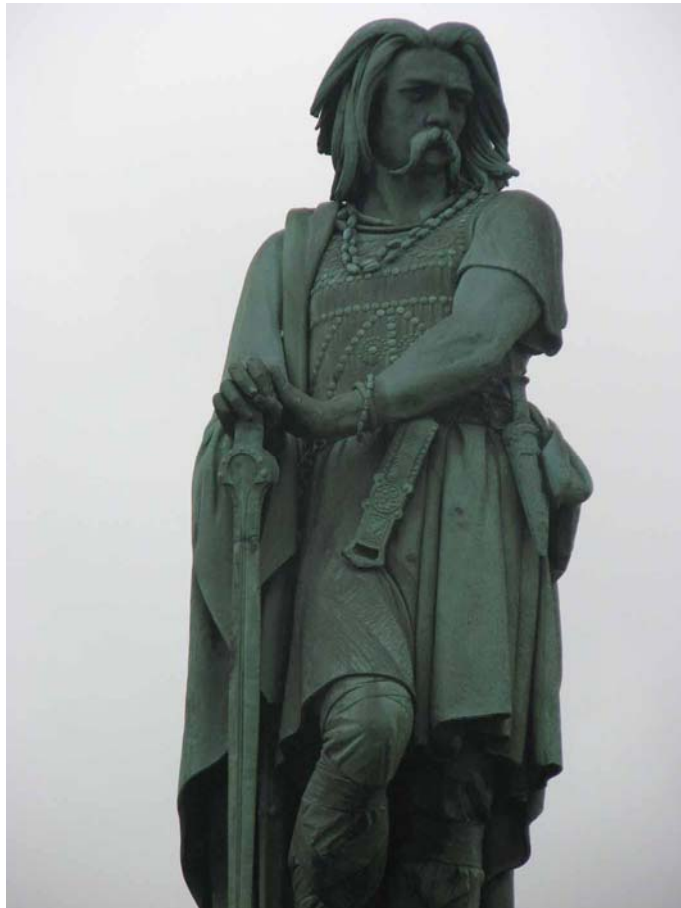
Standbeeld van Vergingetorix in Alesia