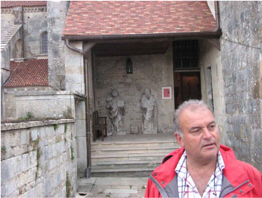
Basiliek Vézelay 13.09.2008