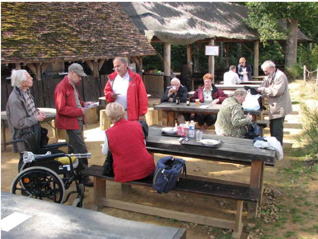
Guédelon vrijdag 12.09.2008

Tegen de avond bereiken we het Dak – hotel in Avallon.