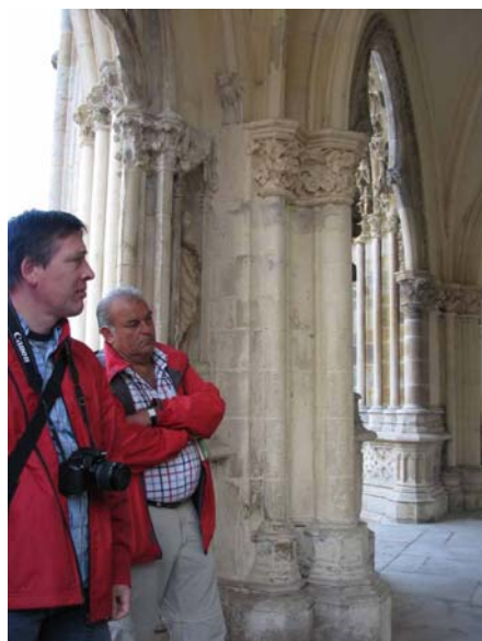
Zaterdagvoormiddag 13.09.2008 Kerk St Père sous Vézelay

Naar de avond toe rijden we terug naar Avallon om, voor dat we slapen gaan, ons te goed te doen aan de Bourgondische keuken in het gastronomisch restaurant Le Relais des Gourmets .