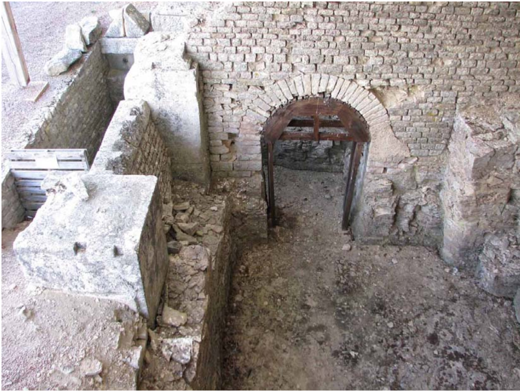
Monument van Ucuëtis in Alesia