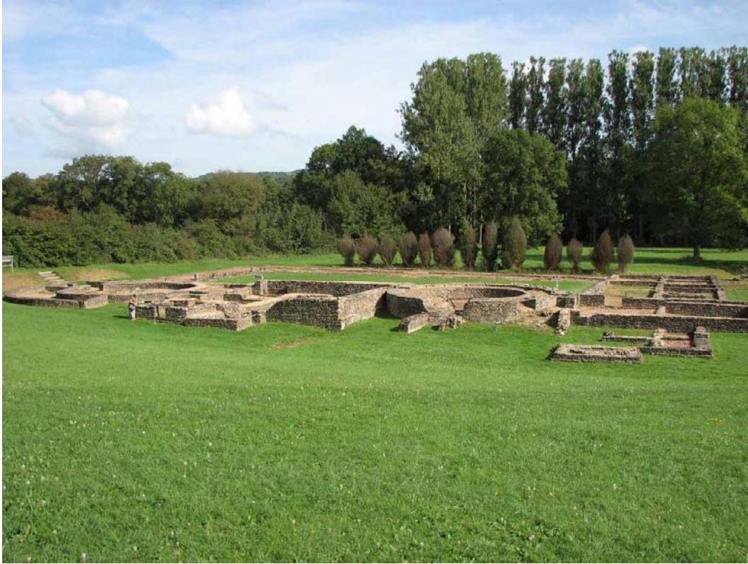
St. Père sous Vézelay, Les Fontaines Salées – Foto J. Goderis