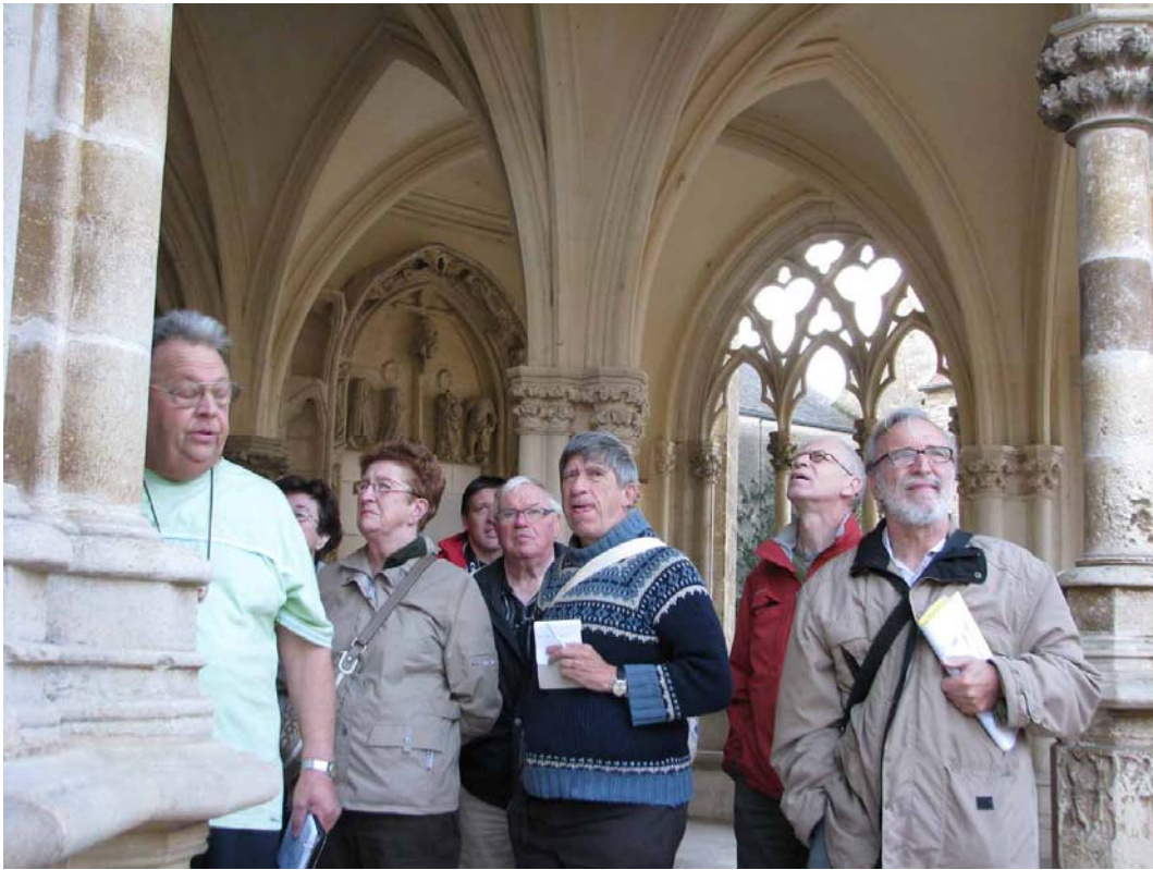
Zaterdagvoormiddag 13.09.2008 Kerk St Père sous Vézelay