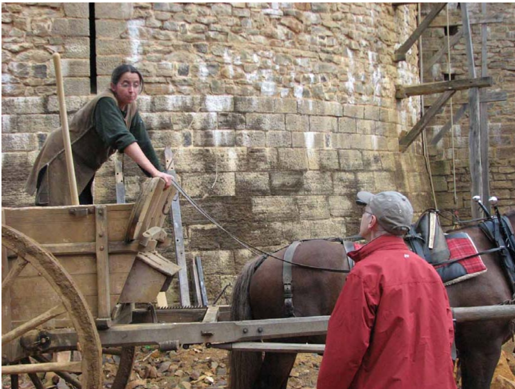
Guédelon vrijdag 12.09.2008