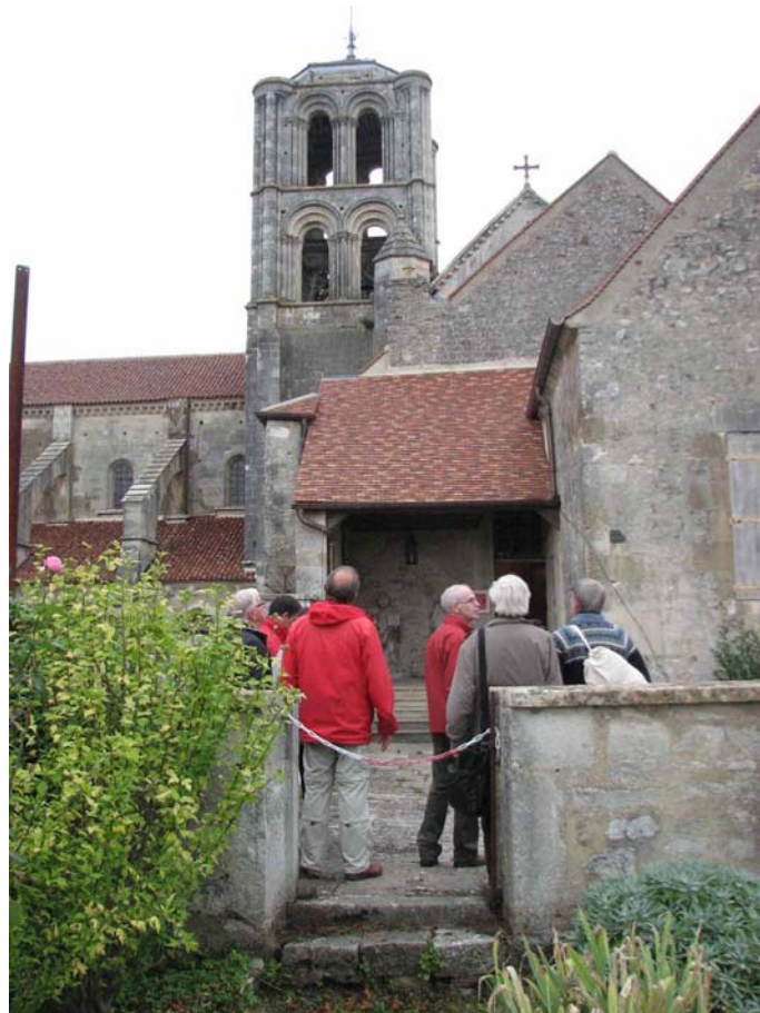
Basiliek Vézelay 13.09.2008