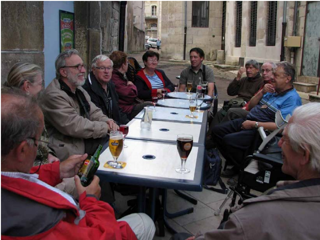
Vrijdag 12.09.2008 op terras in Clamecy op weg naar hotel in Avallon