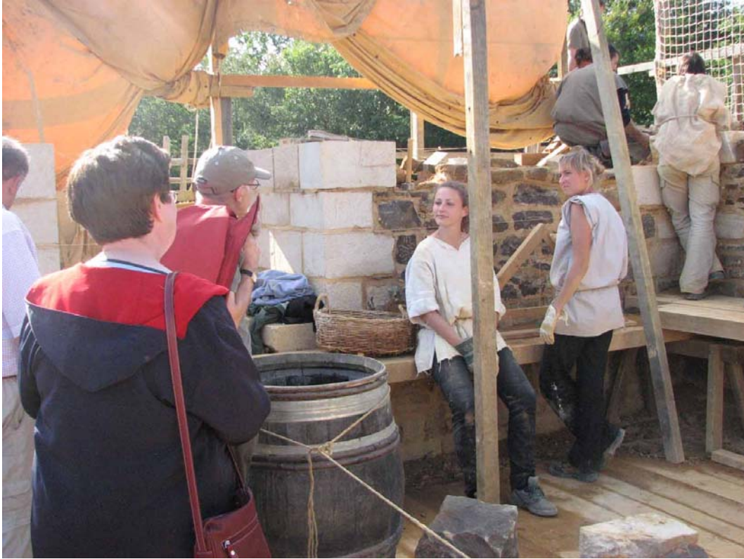
Guédelon vrijdag 12.09.2008