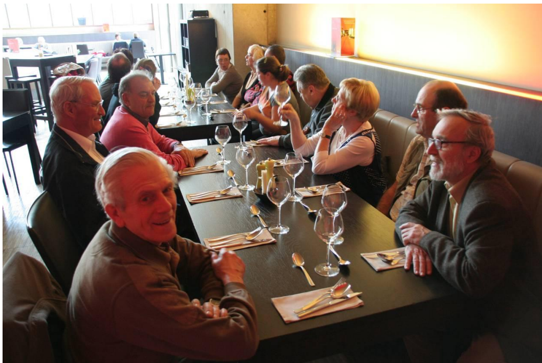
Over de middag gaan we samen tafelen in het museumkafée