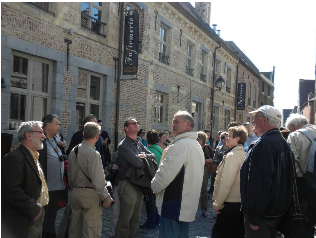
Aan de infirmerie van het begijnhof

We bezoeken verder het Agnetenklooster en het pas opengesteld huisje in het begijnhof, met het begijn-museum Beghina , (woning anno 1660). Dit Begijnhof vormt een ministadje met zes straten en drie waterputten.