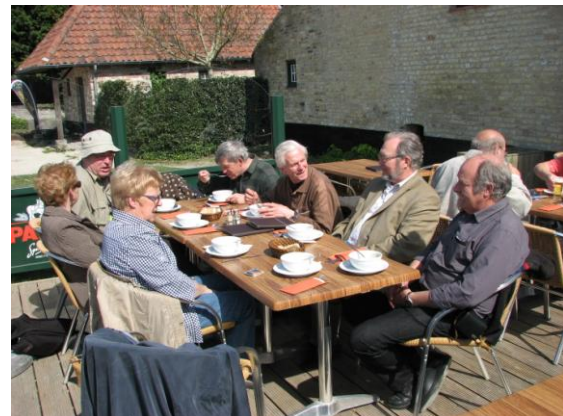
Middagmaal op het terras van Cafeteria "Fort van Beieren"