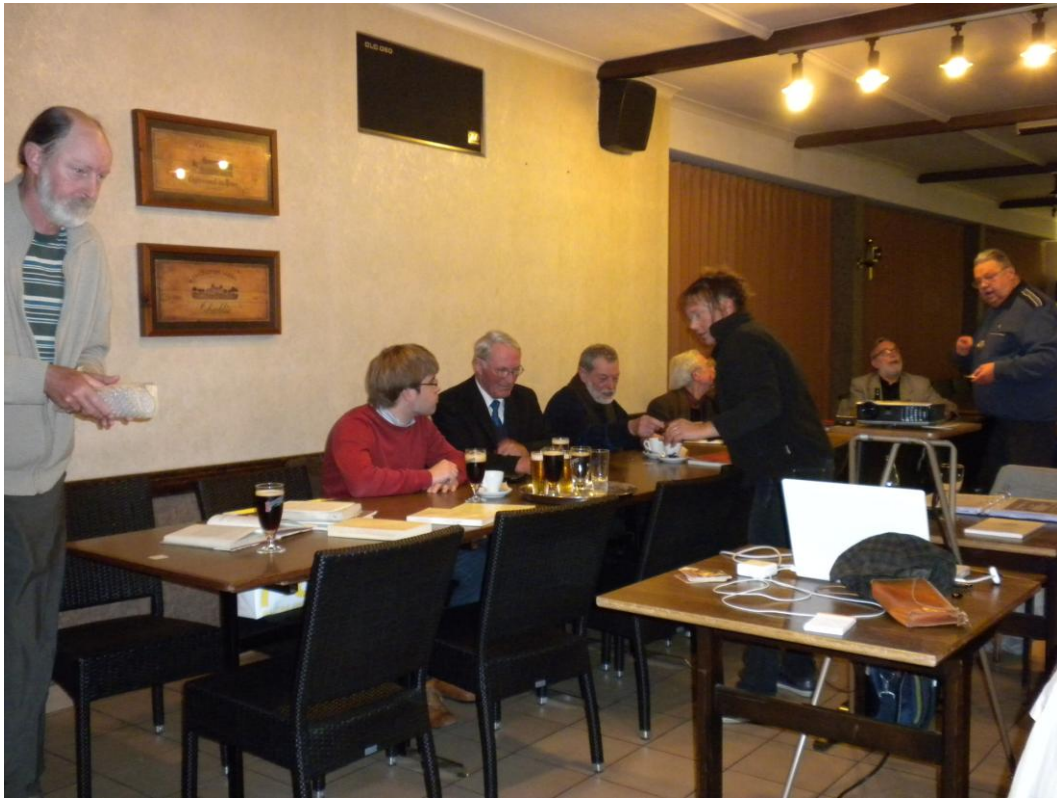
Na de lezing