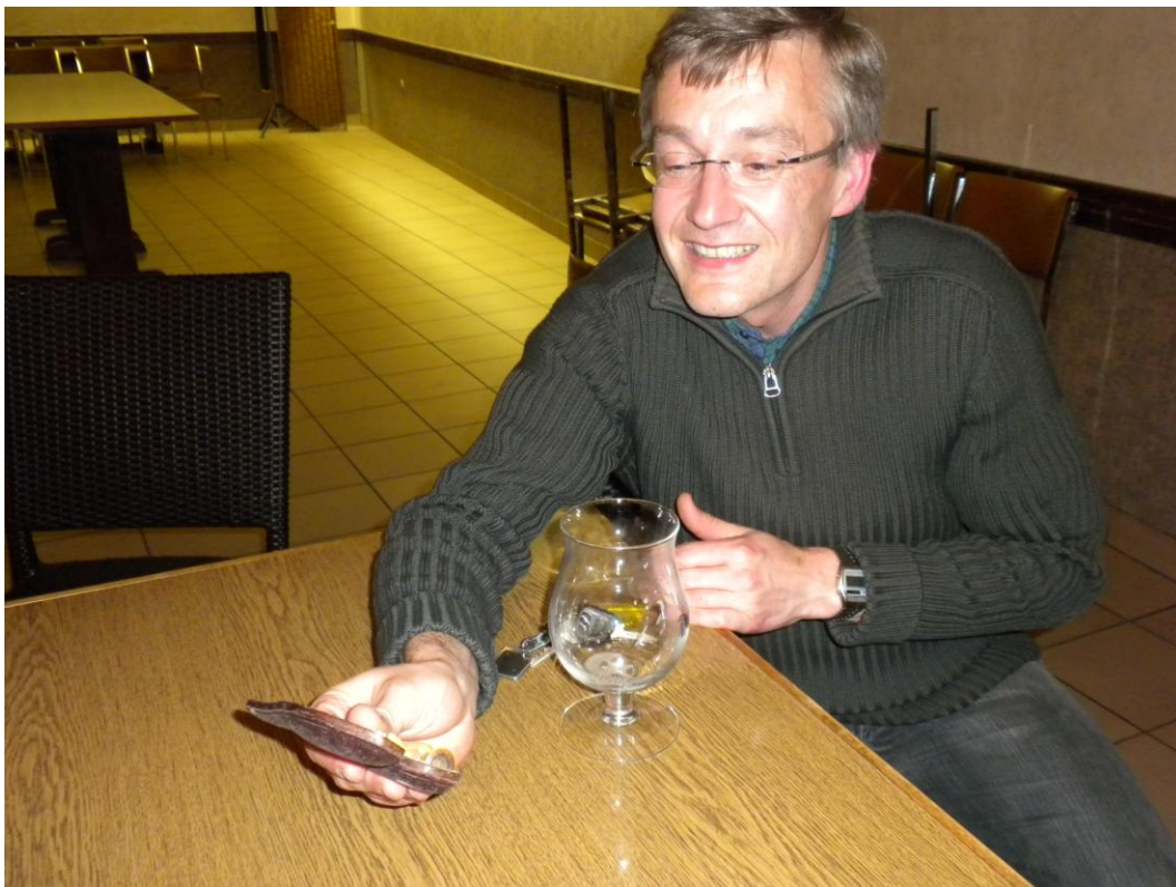
Inspectie van de pijpen