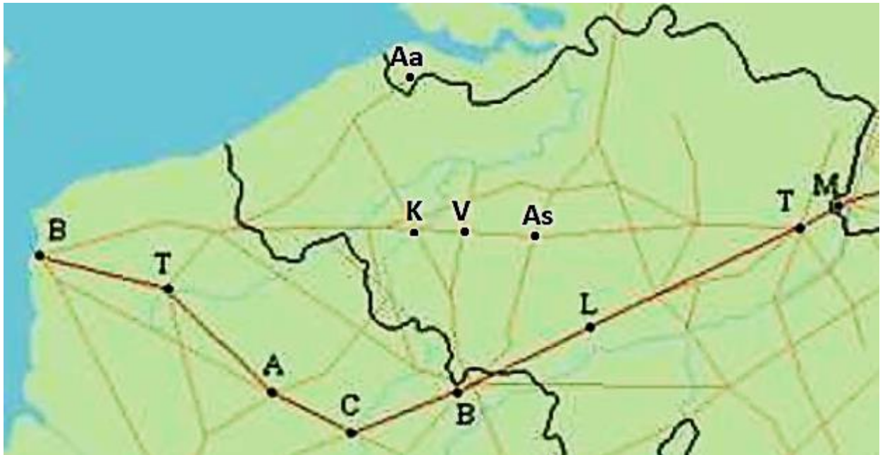
De heirbaan van Boulogne-sur-Mer naar Keulen over Terwaan, Arras, Cambrai, Bavay, Liberchies, Tongeren en Maastricht en de verbindingen van Bavay naar Asse, Velzeke en Aardenburg via Kerkhove.

uit Bavay en omgeving veel afzet hadden in onze streken.