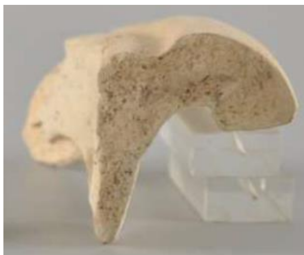
Hier is duidelijk te zien dat we met een Stuart 149 te maken hebben, RAMS00452.