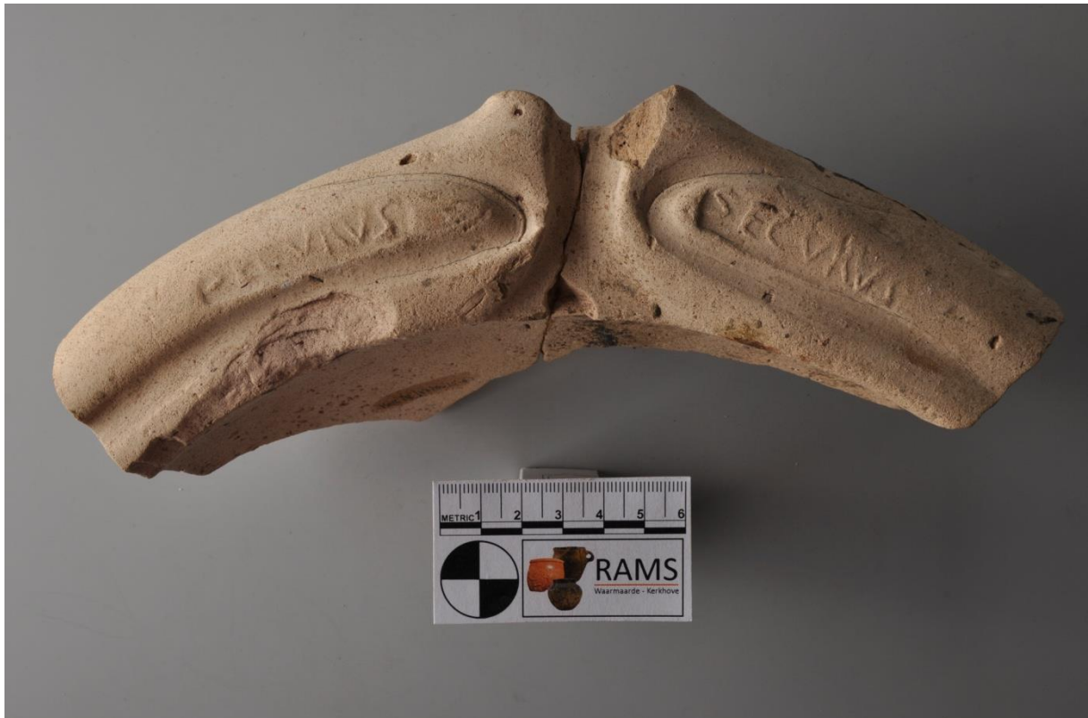
De beide stempels van Securus, links en rechts van de gietuit, gefotografeerd met scheerlicht, RAMS00451