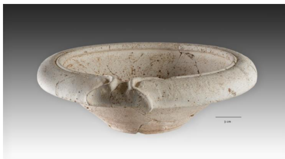
Links: fragment van de binnenkant van een gladwandig mortarium met duidelijk zichtbare gradueel toenemende (van boven naar onder) steenfragmentjes (Kerkhove-Kouter, RAMS00381). Rechts: een typisch voorbeeld van een intact mortarium met gietsluit opgegraven in Bunnik. 1

Vooreerst toch nog eens de definitie van een mortarium of wrijfschaal. Het is een schaal met een gietsluit, waarvan de binnenzijde voorzien is van kleine uit de wand stekende steenfragmentjes. Dit typisch Romeins vaatwerk voor huishoudelijk gebruik was in elke keuken aanwezig en diende om voedsel te vermalen om op die manier papjes, sauzen of pigmenten mee te verkrijgen.