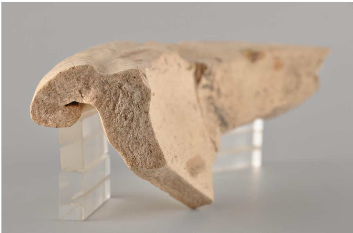
Profielfoto van het Stuart 149 mortarium randfragment RAMS00451