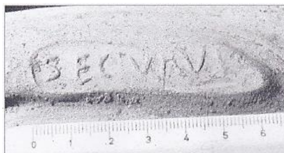
De in Maastricht gevonden stempel (Kloosterman 2006, Plaat 12)

Securus aangetroffen. Andere plaatsen zijn mij niet bekend. Met betrekking tot de chronologie worden de activiteiten van Securus gedateerd tussen 130 en 160 n.Chr. (Carmelez 1980, 47).