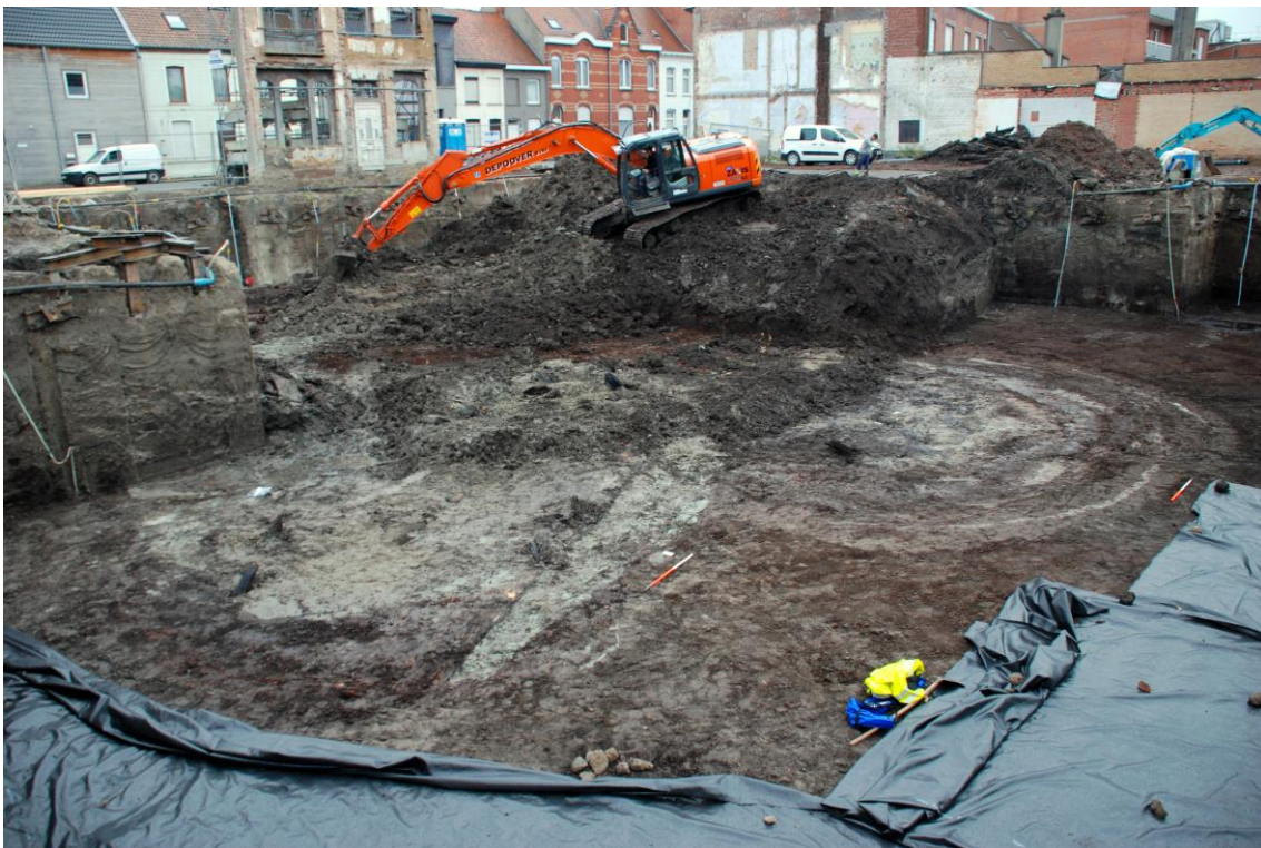
Foto 1, de archeologische vondstlocatie met de veenlaag en de met houten palen versterkte oever of kaaimuur op de bouwwerf aan Diksmuidsesteenweg 28-42 in Roeselare (IOED RADAR 2013).