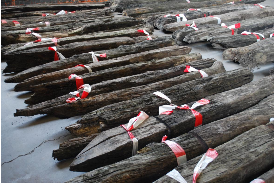
Foto 2, een deel van de ca. 100 aangepunte 13 de eeuwse eikenhouten palen die op de bouwwerf aan de Diksmuisesteenweg 28-42 in Roeselare werden aangetroffen (IOED RADAR 2015).