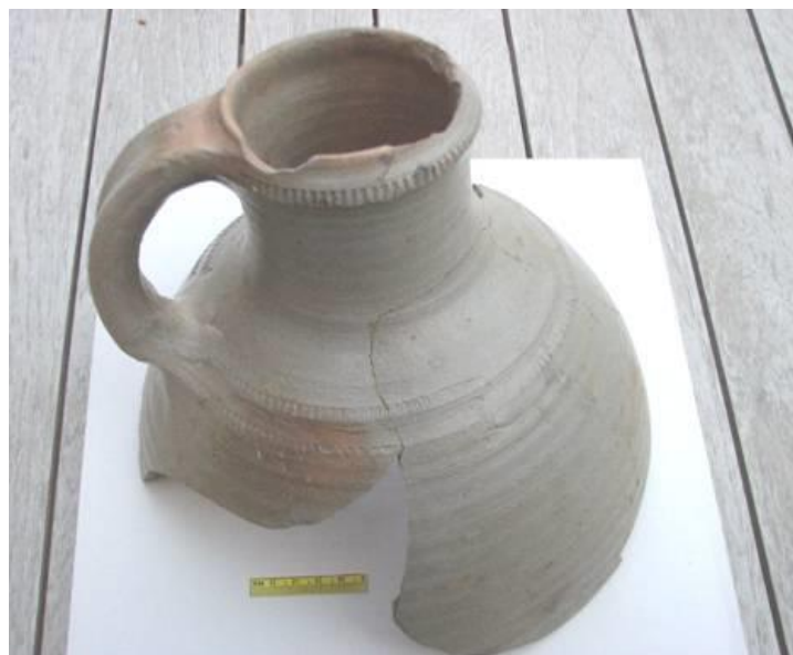
Fig. 20 - Bovenkant van kruik of schenkan in steengoed

Als eerste bekijken we een kruik of schenkan (Fig. 20): Diameter rand 8,5cm; interieur rode scherf, exterieur grijs glanzende glazuur; tweeledige staande oor, breedte 3,5cm; draairibbels met breedte van 1 tot 1,2 cm; Rolstempel-versiering op de bovenrand en op de overvloei van hals naar schouder. Datering 14 de -15 de eeuw, herkomst kan Siegburg zijn.