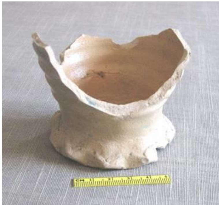
Fig. 23 – bodem van eivormige beker

In de late middeleeuwen bezaten de inwoners in Vlaanderen doorgaans steengoed-drinkgerei. Steengoed kreeg de voorkeur boven drinkgerei in hout of metaal en zeker drinkvormen in rood aardewerk zijn te poreus! Steengoed is gemakkelijker om proper te houden en is waterdicht. Steengoedbaksel is echter niet geschikt om met vuur in aanraking te komen. Dus best vooral aangewezen om vloeistoffen in op te slaan (schenkgerei) of om uit te drinken (drinkgerei).