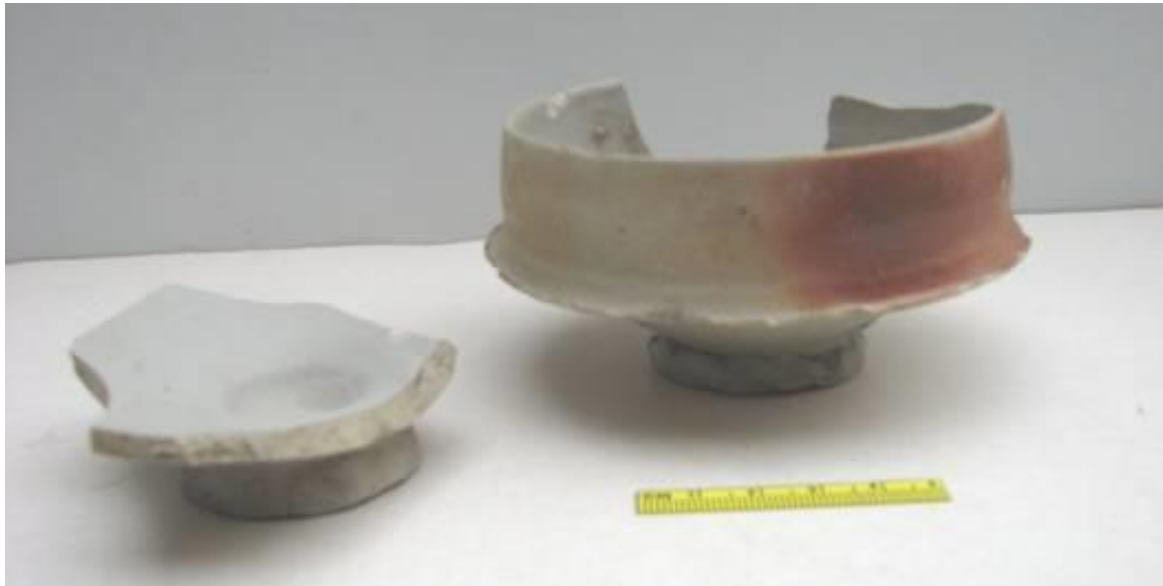
Fig. 24 – Drinknappen.