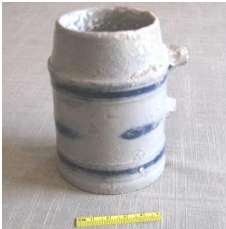
Fig. 22– Schnelle of drinkbeker met verticaal aangebracht handvat (afgebroken)

Schnelle (Fig. 22) met afgeschuinde rand, met daaronder een ribbel; platte basis. Steengoed met grijs zoutglazuur; Kobalt - blauwe horizontale strepen. Hoogte 10cm; diameter rand 6,5cm, diameter basis 7,5cm. Afkomst is Bouffiuux, datering kan geplaatst worden in laat 18 de , vroeg 19 de eeuw.